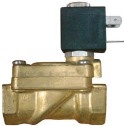
Figura 15. Válvulas solenoides o electroválvulas

Con estas válvulas se hizo la repartición del fluido desde la bomba a cada zona a regar.