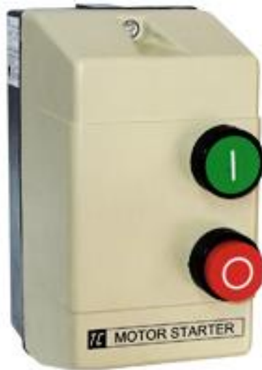
Figura 13. Arrancador termo magnético este le dará a la motobomba la orden de encendido y apagado.