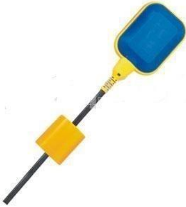
Figura 12. Control de nivel este va ubicado dentro del tanque de 500 litros, y es el que nos mide el nivel del agua.