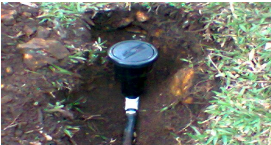
Figura 18. Instalaciones del Rain Bird.