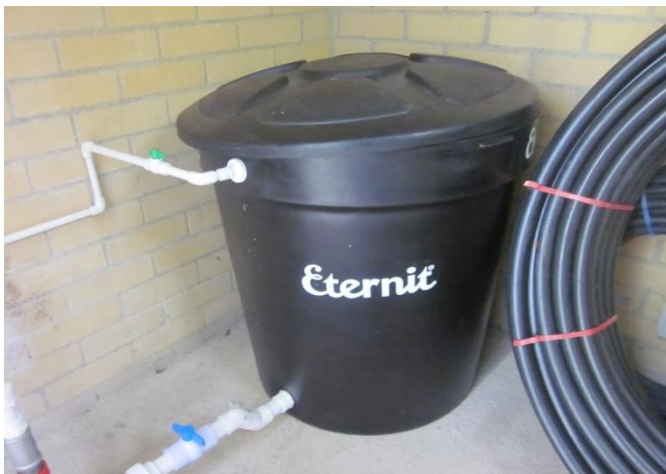
Figura 9. Tanque 500 litros, este nos servirá para almacenar el agua que llegara a los aspersores.