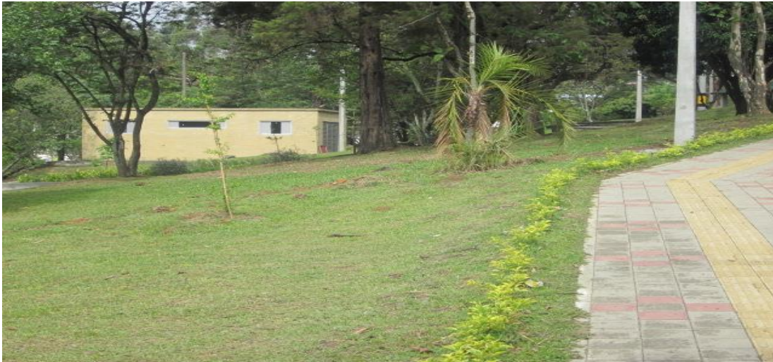
Figura 5. Zona de prados alrededor de la biblioteca de la Institución Universitaria Pascual Bravo.