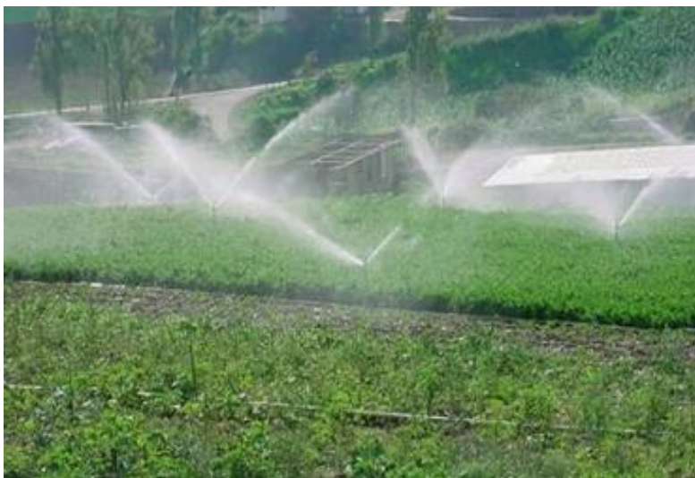
Figura 8. Implementación del sistema de riego según el sector agrícola