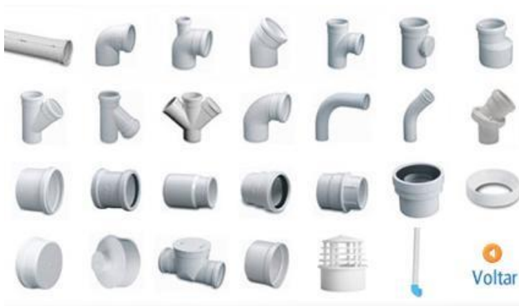
Figura 14. Tubería pvc con esta hicimos la conexión de la motobomba a la tubería de polietileno.

Fuente: http://www.euroresidentes.com/jardineria/sistemas_de_riego/riego/riego_en_casa/sistemas_riego_automatico/index.htm