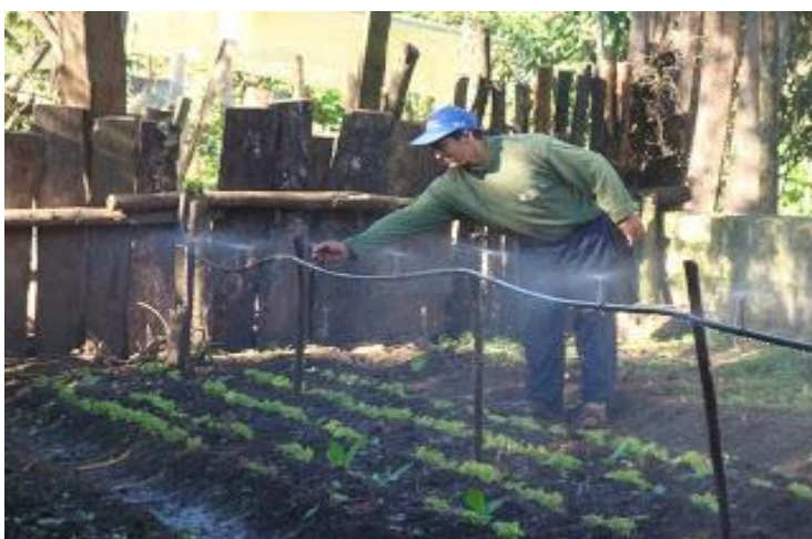
Figura 7. Sistemas de aspersión artesanales en Colombia.