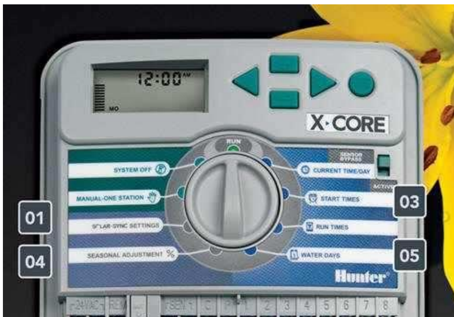
Figura 11. Programador este se encuentra conectado a la válvula Solenoide y le da la orden de cerrar y abrir el paso de agua.