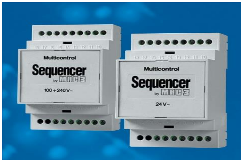
Figura 19. Bomba relé alterna Sequencer

Gracias a este dispositivo, es posible realizar el control del sistema de autoclave convencional, con la única adición del contactor y la parte térmica, a costos muy reducidos.