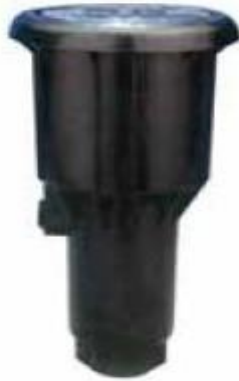
Figura 16. Aspersor Rain Bird.

Estos son los aspersores utilizados para modificar el sistema de riego que hay en la Institución Universitaria Pascual Bravo.