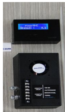
plug and play